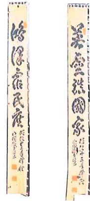
白鳥神社幟旗(パネル展示)